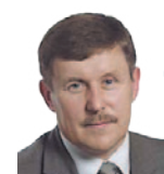
Zbigniew Kuźmiuk Poseł do Parlamentu Europejskiego

Mimo tego, że minister Sawicki kieruje już resortem rolnictwa prawie 8 lat (z krótką przerwą, kiedy to ministrem rolnictwa był Stanisław Kalemba, ale także z PSL-u), niestety niewiele w tych sprawach zrobił, zarówno na unijnym forum, jak i w ramach krajowej polityki rolnej.