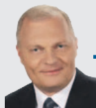
Lech Kołakowski Poseł na Sejm RP

Po co więc gnębić rolników ogromnymi karąmi, skoro limity produkcyjne odchodzą do przeszłości?