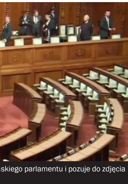
skiego parlamentu i pozuje do zdjęcia

nogach lawirował między grobami polskich żołnierzy na cmentarzu w Charkowie. Albo jak próbował