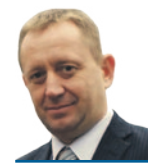
Robert Telus Poseł na Sejm RP