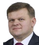
Wojciech Skurkiewicz, Senator RP