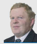
Grzegorz Wojciechowski Senator RP

W latach 2007-2013 na dopłaty wydano 87,1 mld zł. Plan na lata 2014-2020 przewiduje 77,2 mld zł. Pomijając inflację, na dopłaty dla polskich rolników w obecnej perspektywie przeznaczono kwotę niższą o prawie 13% tj. 10 mld zł. Tak wygląda sukces polityki Sawickiego, Tuska, Sikorskiego, Kopacz i całego Rządu PO-PSL.