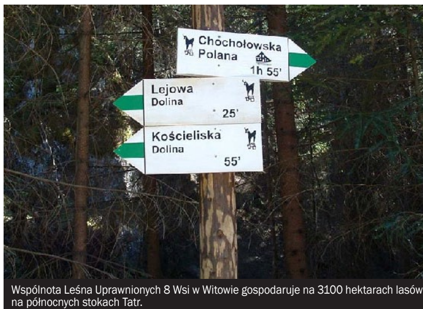
Wspólnota Leśna Uprawnionych 8 Wsi w Witowie gospodaruje na 3100 hektarach lasów na północnych stokach Tatr.

Rządowy projekt nowelizacji ustawy budzi daleko idące wątpliwości. Proponowane nowe zapisy dotyczące ustalania uprawnionych do udziału we wspólnocie