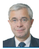
Jerzy Chróścikowski Senator RP, Przewodniczący NSZZ Rolników Indywidualnych „Solidarność”

gie ciągniki, otrzymywanie wysokich dopłat obszarowych i wsparcia na inwestycje. Dla rolnika sprzęt rolniczy nie jest żadnym luksusem, lecz jego podstawowym narzędziem pracy. Natomiast nikt nie mówi o tym, że rolnicy kupują nowe ciągniki na kredyt, który muszą spłacić. To prawda, że rolnicy korzystają z różnych programów wsparcia ze środków unijnych. Jednak aby z tych środków skorzystać, muszą mieć wkład własny, a przy wysokich cenach ziemi i sprzętu rolniczego, wkład własny jest bardzo wysoki. Dodać należy, że ceny środków produkcji, nawozów, środków ochrony roślin stale rosną, a ceny produktów rolnych są na tym samym poziomie od kilku, a nawet czasami kilkunastu lat.