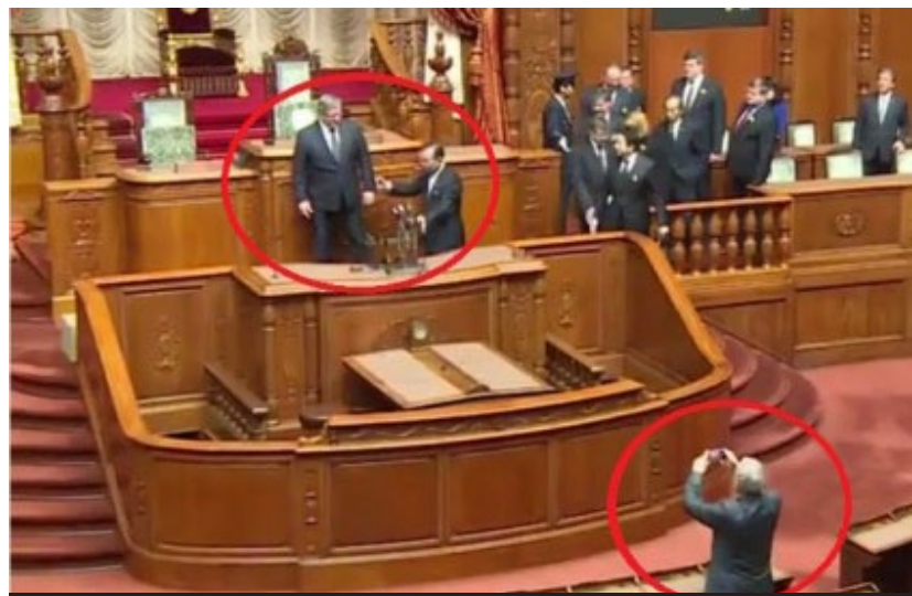
Bronisław Komorowski, Prezydent RP, stoi na krześle sprawozdawcy japońskiego generałowi, „szogunowi” Stanisławowi Koziejowi.

Prezydentura Bronisława Komorowskiego od samego początku upływa pod znakiem dyplomatycznych gaf i towarzyskich wpadek.