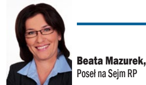
Beata Mazurek, Poseł na Sejm RP

W sytuacji łamania przyjętych zasad przez inne kraje unijne i „ogrywania” nas na europejskim rynku, Polska musi wyciągnąć wnioski i w zdecydowanie większym niż do tej pory zakresie pilnować własnej, narodowej polityki rolnej. Naturalnie, wpływanie na instytucje europejskie i inne kraje UE w obronie europejskich wartości jest zadaniem nadrzędnym i pierwszoplanowym, jednak obrona własnego rolnictwa i stabilizacja rynku wewnętrznego wydają się chyba być oczywiste. Nie wolno niszczyć polskiego rolnictwa i „rozwalac” poszczególnych rynków nie oferując rolnikom nic w zamian. Tym, którzy rządzą od prawie 8 lat, polscy rolnicy właśnie na blokadach dróg wystawiają rachunek.