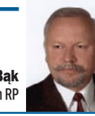
Dariusz Bąk Poseł na Sejm RP