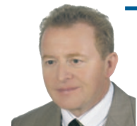
Janusz Wojciechowski Poseł do Parlamentu Europejskiego, Wiceprzewodniczący Komisji Rolnictwa