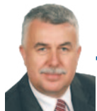
Sławomir Zawisła Poseł na Sejm RP

Eksport żywności wzrósł w ciągu ostatnich trzech lat o ok. 20 procent, a dochody rolników spadły o 11 procent.