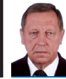
prof. dr hab. Jan Szyszko Poseł na Sejm RP Pełnomocnik d.s. referendum

leczno przekazu jak: Radio Maryja, TV Trwam, Nasz Dziennik, tygodnik Niedziela i Gazeta Polska. Mimo iż do chwili obecnej zebrano i złożono do Marszałka Sejmu już ponad 2,6 mln podpisów, mimo wielokrotnego kierowania pism do Marszałka w sprawie wprowadzenia tego ważnego punktu pod obrady Sejmu i mimo uruchomienia „zielonego miasteczka” przez rolników pod Kancelarią Premiera, koalicja rządząca jest całkowicie głucha na głos narodu. Koalicja rządząca boi się debaty. Koalicja rządząca boi się zbierania podpisów pod referendum i uważa, że „chowając głowę w piasek”, nie zauważając problemu i nie pozwalając na uwidacznianie go w podległych jej środkach społecznego przekazu, zmoczy naród i doprowadzi swoje dzieło do końca. Nie możemy na to pozwolić. Łączmy siły, zbierajmy podpisy, wspierajmy protestujących Rolników. To nasza szansa na istnienie i odbudowę silnej Ojczyzny.