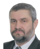
Jan Krzysztof Ardanowski Poseł na Sejm RP Wiceprzewodniczący Sejmowej Komisji Rolnictwa i Rozwoju Wsi