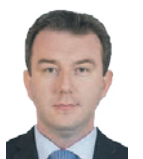
Przemysław Błaszczyk, Senator RP

Źródło: Ubóstwo w Polsce w świetle badań GUS. Studia i Analizy Statystyczne. Główny Urząd Statystyczny, Departament Badań Społecznych i Warunków Życia, Warszawa 2013 str. 72 http://biznes.onet.pl/wiadomosci/kraj/mapa-polskiej-biedy/qhd#2 Główny Urząd Statystyczny - Bank Danych Lokalnych