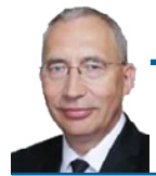
Kazimierz Smoliński Poseł na Sejm RP

Jak widać w krajach Unii Europejskiej obowiązują ograniczenia w sprzedaży ziemi rolnej, które mogą też być zastosowane w Polsce. Dlaczego polski rząd zwleka z ich wprowadzeniem? Czyżby chodziło o jak najdłuższe przeciąganie obecnego stanu prawnego i jak często bywało, powstanie sytuacja, że przez kilka dni będzie luka w prawie i w tym czasie dokonane zostanie wiele transakcji obrotu ziemią przez obcokrajowców?